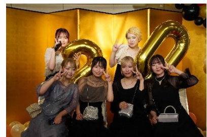
※写真は令和7年度 庄原“リンク”同窓会の様子