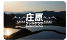
庄原ファンクラブ会員証