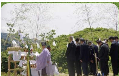
道後山登山安全祈願祭