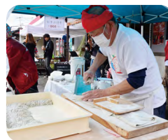
「西城新そば祭り」※昨年の様子

当日、備後西城駅では「西城新そば祭り」が行われ、町内の特産品などが味わえます。熊野神社では、老杉群や趣のある境内など、雄大な自然を肌で感じることができます。