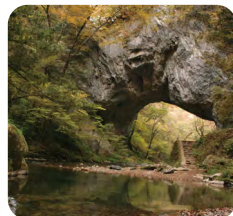
上帝釈のシンボル「雄橋」

国の名勝指定から100年を迎える「帝釈峡」の紅葉を楽しむことができます。10/29(日)は帝釈自治振興センターで「帝釈もみじまつり」が行われ、地元食材を使った出店などが行われます。(「上帝釈」降車場所から徒歩約10分)