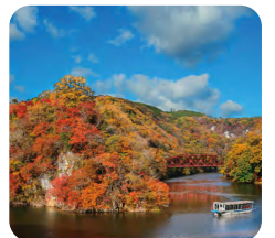
下帝釈の名所「神龍湖」と遊覧船