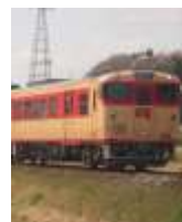
【臨時記念列車「ノスタルジー」】

大阪府出身。平成24年「NHKのど自慢チャンピオン大会」でグランドチャンピオンに輝く。翌年CDデビューし、平成26年「第56回輝く！日本レコード大賞」で新人賞を受賞。歌手として活躍する傍ら、“撮り鉄”として鉄道写真の撮影を趣味とするなど、鉄道ファンとして知られている。