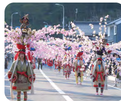
お通りのシンボル「母衣」

関ヶ原の戦い後、東城を治めた大名の軍勢を再現した武者行列や大名行列、可愛い衣装の華童子行列などが東城のまちなかを練り歩く荘厳な姿を目にすることができます。