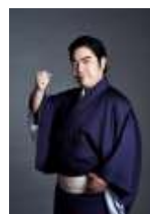
【徳永 ゆうき さん】

大阪府出身。平成24年「NHKのど自慢チャンピオン大会」でグランドチャンピオンに輝く。翌年CDデビューし、平成26年「第56回輝く！日本レコード大賞」で新人賞を受賞。歌手として活躍する傍ら、“撮り鉄”として鉄道写真の撮影を趣味とするなど、鉄道ファンとして知られている。