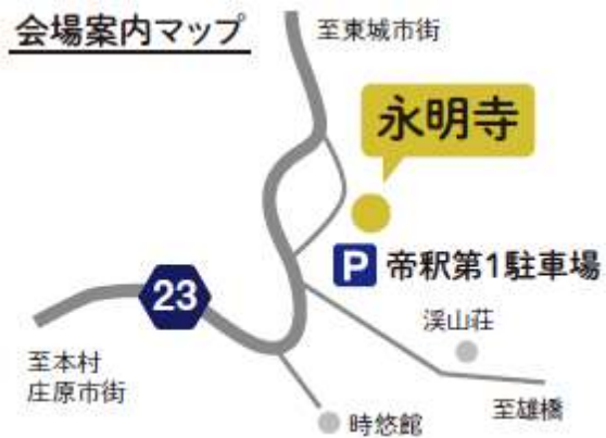
ライトアップ会場全体図（永明寺・帝釈第1駐車場）