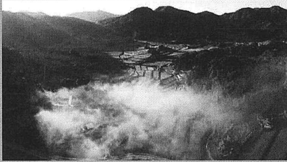
見渡す限りの古民家と整った鉄穴流しの棚田の里