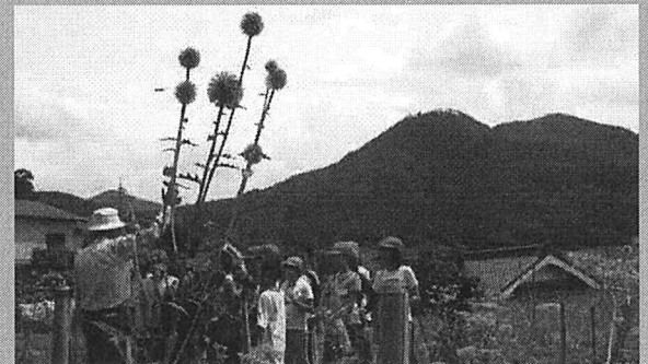
絶滅危惧種ヒゴタイと三河内子ども農村交流