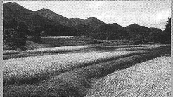
ソバを作付けして農地の保全と景観を保持