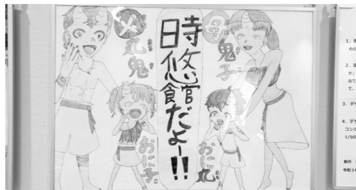
▲越さんが作成した看板デザイン案