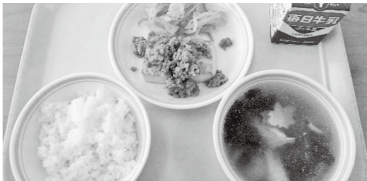
▲「だし」を生かした献立（マダイの吸い物など）

食べることは生きる上での基本であり、知育、徳育、体育の基礎となります。 さまざまな体験を通じて「食」に関する知識と、「食」を選択する力を習得し、健全な生活を実践することができる人間を育てる食育を推進することが求められています。 市内の学校では、平成28年度から「だしで味わう和食の日」の取り組みを進めています。栄養教諭と担任が協力し、和食の歴史など、食に関する授業を行ったり、「和食の日」（11月24日）の週に「だし」を生かした給食メニューを提供したりしています。「だし」を多く使用した給食は、「だし」のうま味で調味料や塩分を抑えることができ、児童に食材の本来の味を知ってもらう機会となっています。