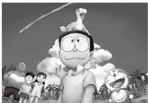
ドラえもん のび太の新恐竜

※掲載の内容は、新型コロナウイルスなどの影響により中止・延期・変更となる場合があります。お越しの際はマスクの着用など感染症対策をお願いします。