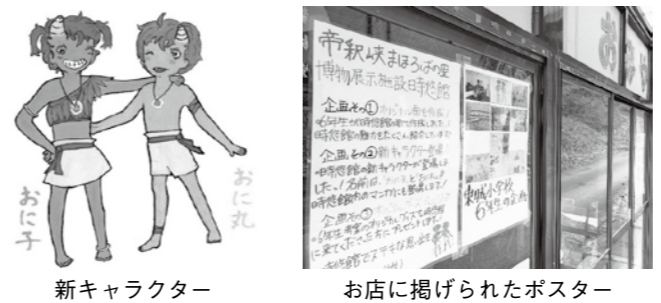
新キャラクター お店に掲げられたポスター

時悠館は、「帝釈峡と人々をつなぐビジターセンター」を目指して、多様な主体と連携した運営に取り組んでいます。今回はその一部を紹介します。 当館は平成30年度から、東城小学校6年生との共同研究を進めています。令和元年度は2クラス52人の児童が、「時悠館アピール大作戦～地域の願いを知って～」と題して、帝釈峡や時悠館にもっと多くの人を訪れるようになることを目指し、グループに分かれて解決策を模索しました。 「こんなものがあったら帝釈峡や時悠館へ行ってみたいくなる！」というコンセプトのもと、さまざまな企画が動き出しました。児童の自由な発想をもとに、案内看板・ポスター・パンフレットの製作や、新キャラクター・グッズの作成、土器の重さ体験、古代の生活体験、さらにはオリジナルソングの作曲など、さまざまな企画が具体化されました。