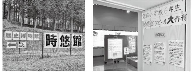
館外の案内看板 ミニ企画展「時悠館アピール大作戦」

また、児童の活動では、当館や東城小学校だけでなく、帝釈文化研究会、帝釈峡観光協会が連携・協力することで、子どもと大人が共に学び合うことができました。 その連携・協力が進んだ結果、現在、有志により「時悠館友の会」(仮称)の立ち上げも進みつつあります。当館はこれからも、地域と共に歩む博物館として、市民が主役の館運営を続けていきます。