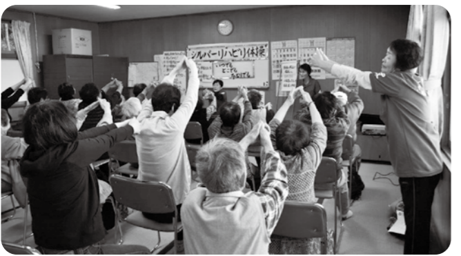
指導士の企画・運営による教室のようす【東城支部】

アドバイスをしながら、体操を進めていきます。体操教室を定期的に開催することで、来る人が顔見知りになり、欠席が続く人を気にかけるなど、人と人とのつながりづくりになっています。また、参加者との交流は、指導士のモチベーションアップにもつながっています。