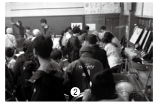
① 今回会場となる旧竹地谷小学校（口和町） ② 昨年度の会場の様子 ③④ 今回もたくさんさんの学校備品がそろっています（写真は昨年度）

庄原市内の廃校施設で長年使われていなかった学校備品を販売します。売上げは全て、庄原市の将来を担う子どもたちの教育費として使います。忘れられ捨てられるのではなく、新たな脚光を浴びることが出来る場所に送り届けたい。そんな思いから「廃校ノスタルジアin庄原」を開催しています。今回は、口和町の旧竹地谷小学校を会場とし、庄原市内の廃校となった施設などから、学校給食用品、跳び箱、楽器や理科の実験道具など多数出品します。学校備品の新たな門出となる日、一日だけの開校日です。この機会に学校を懐かしみ楽しんでください。多くの方々の