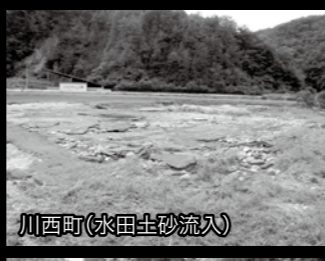
川西町【水田土砂流入】