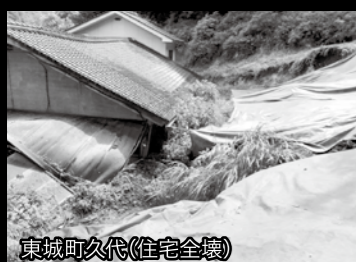
東城町久代【住宅全壊】