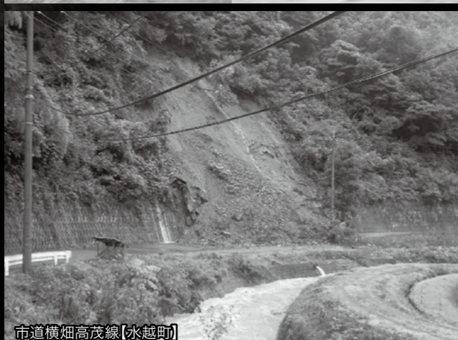
市道横畑高茂線【水越町】