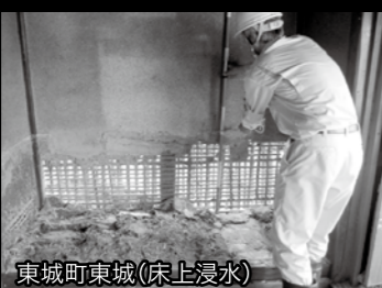
東城町東城【床上浸水】