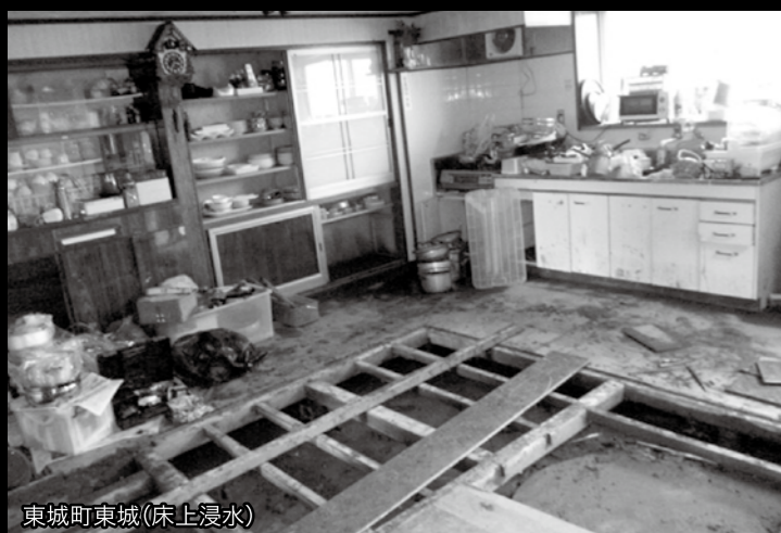
東城町東城【床上浸水】