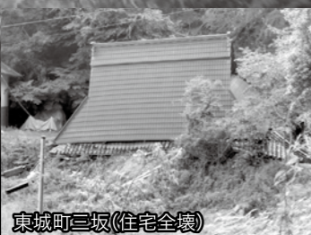
東城町三坂【住宅全壊】