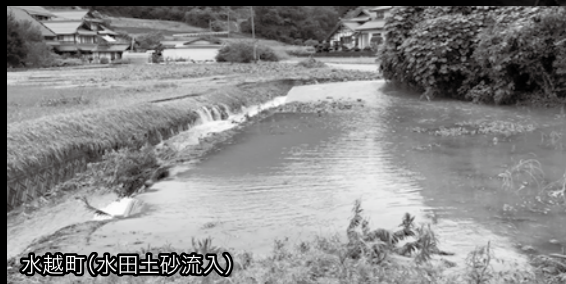
水越町【水田土砂流入】