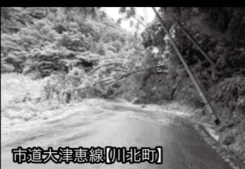
市道大津恵線【川北町】