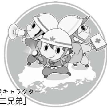
広島県防災キャラクター「タスケ三兄弟」

広島県では、各家庭での備蓄などの防災対策の促進のため、協賛企業の店舗で「みんなで減災」備えるフェアを開催します。このフェアをきっかけに「家庭での備え」について考えてみませんか。