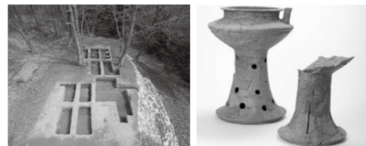
▲佐田谷3号墳 ▲注口付脚台付鉢型土器

なお、本年は国史跡指定から5周年を迎え、講演会の開催も予定しています。詳細は改めて広報紙などでお知らせします。