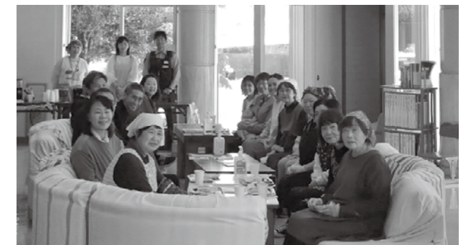
▲カフェをゆっくり楽しむ参加者

参加者は「地域の皆さんが気軽に立ち寄り、つながりを感じられる場所として、これからも続けてほしい」と話しました。