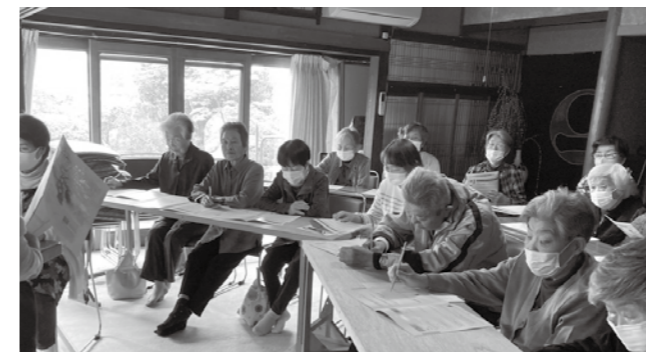
▲熱心に説明を聞き、ノートを書く参加者

参加者は、「以前からこのようなノートが欲しいと思っていたのでありがたい」「自分自身を振り返り、これからどう生きていきたいのか考える機会になった」と話しました。