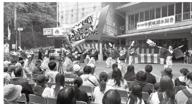
▲ステージイベントを楽しむ来場者

来場者は「出演者だけでなく観客も参加できるステージイベントがあり、とても楽しかった」と話しました。