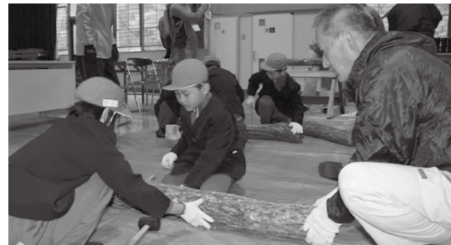
▲熱心に植菌作業に取り組む児童たち