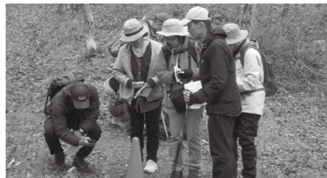
▲草花を観察する参加者たち

参加者は「講師の詳しい説明があり本当によく分かった。次回の講座にも参加したい」と話しました。