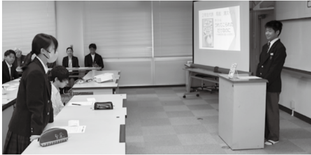
ビブリオバトルで意見を交わし合う生徒（高野中学校）