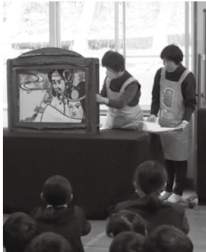
ダンボの会の読み語り （西城小学校）