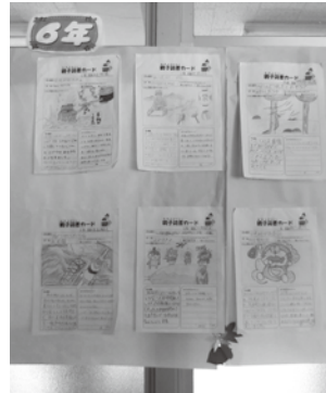
校内に掲示した親子読書カード （総領小学校）