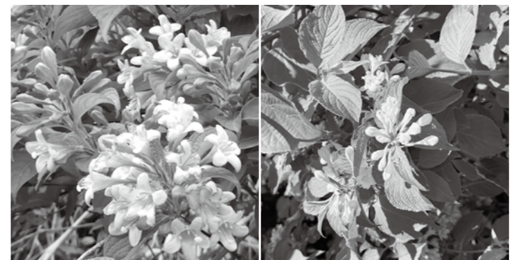
▲タニウツギの花 ▲タニウツギの白花(吾妻山にて)

タニウツギは、スイカズラ科の落葉低木で、日本海側の多雪地帯に多く、平地から谷筋の湿気の多い場所などさまざまな環境で生育しています。 根元からよく枝分かれして株立ちになり、枝先や葉の脇にピンク色の花をたくさんつけ、満開時は枝がしなるほどになります。ごくまれに白色の花をつけるものもあります。 田植えのころピンク色の花が咲くことから「タウエバナ」の呼び名や、早乙女に見立て「ソウトメバナ」と呼ばれています。 漢字では「谷卯木」または「谷空木」と書きますが、「卯木」は卯月（陽暦5月）に咲くから、「空木」は小枝が中空なのでその名が付いたと言われています。 ちなみに、「夏は来ぬ」に歌われる卯の花は「ウツギ」（アジサイ科）のことで、名前は似ていますが、別の科に属する植物です。 6月初旬に吾妻山で行う初夏の草花ウォッチングの頃には花盛りを迎え、甘い蜜を求めて、マルハナバチ類やハナムグリ、アゲハチョウなどの昆虫も集まってきます。