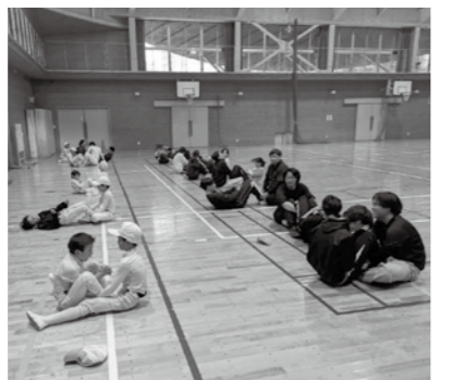
子どもたちと一緒にストレッチ

※4月号の市政トピックスでは、組織機構の再編に伴い新設・変更のあった部署においても、イベント実施時点の部署名で表記しています。