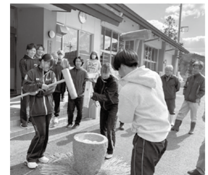
初めての餅つきに四苦八苦する姿も

滞在中は、東城町の(株)八幡ファームでイチゴの定植やハウスの解体など、農作業を中心とした活動を行いました。農家の方と共に汗を流しました。また、地域体験として、東城ファイターズの野球練習に参加し、子どもたちと触れ合ったほか、八幡自治振興センターで餅つきなどをして地域の人たちと交流を深めました。