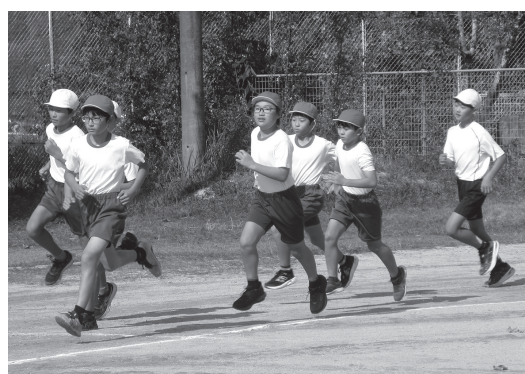
永末小の校内マラソン大会

本市の小学5年生は男女ともに、中学2年生は女子が、体力合計点で広島県と全国の平均を上回りました。