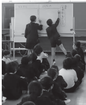
山内小学校の児童自治朝会