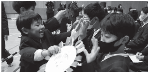
板橋小学校の「6年生を送る会」