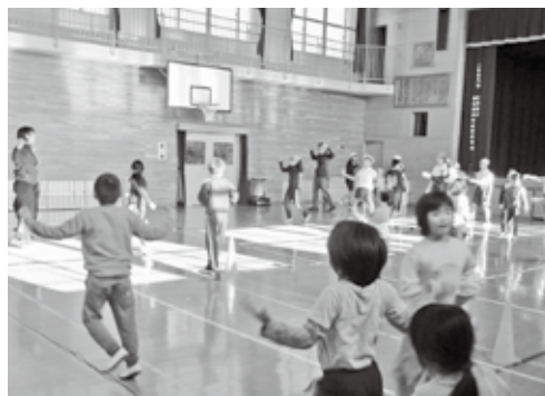
峰田小学校全校でのリズム運動の取り組み

体力向上の要因として、新型コロナウイルス感染症が5類感染症に分類されてから、児童生徒の運動の機会が増加したことに加え、児童生徒が運動の楽しさを感じながら十分に運動ができるよう、各学校で体育の授業や全校での取り組みを工夫したことが考えられます。この取り組みの一例として、峰田小学校では音楽に合わせ、跳んだり止まったりするリズム運動を行っています。