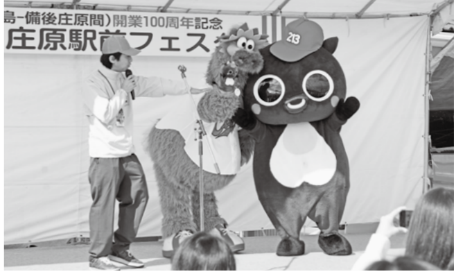
芸備線・木次線の沿線自治体のPRコーナー