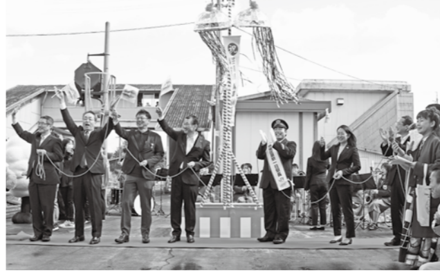
100周年を祝いくす玉を開披