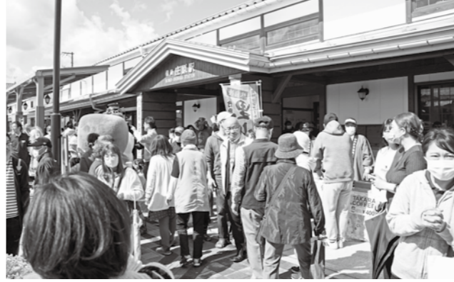
多くの人でにぎわう会場