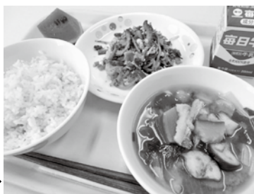
【7月19日の給食】 庄原産のイノシシ肉を使った料理を提供

★「庄原食育の日（郷土料理・地産地消）」（毎月19日） 地産地消は、その地域特有の風土の中で培われた食文化や、農業をはじめとする地域産業の状況を理解し、農作物を作ってくれる人たちへの感謝の心を育むことにつながります。郷土料理は、地域に伝わる伝統的な食文化であり、本市にあるより豊かな食生活が子どもたちに引き継がれていくことが重要です。給食を通じて、子ども、職員、保護者が地産地消や郷土料理への理解をより深め、継承していくことを目的として実施しています。