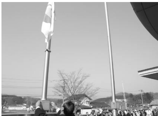
市旗を掲揚(高野支所)

31日には、市役所本庁舎前での開庁式のほか、合併に伴う式典や行事などが市内各地で開催されました。