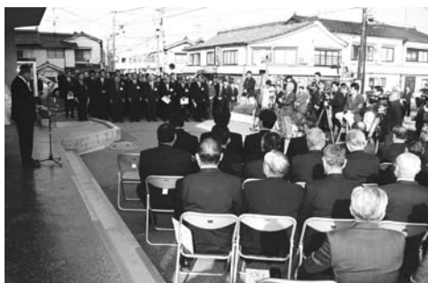
多くの出席のもと開催された本庁の開庁式