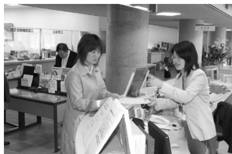
窓口での対応(東城支所)