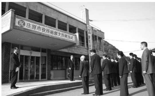
支所では開所式(総領支所)