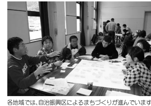
各地域では、自治振興区によるまちづくりが進んでいます