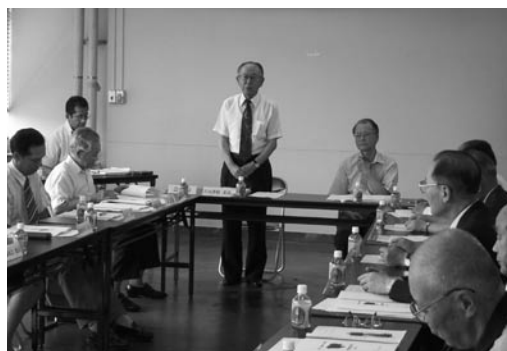
それぞれの地域の発展を願い話し合う皆さん