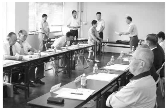
委員の皆さんに委嘱状を手渡す瀧口市長