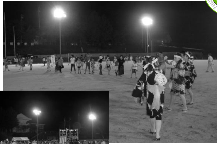
やぐらをかんこんでの盆踊り