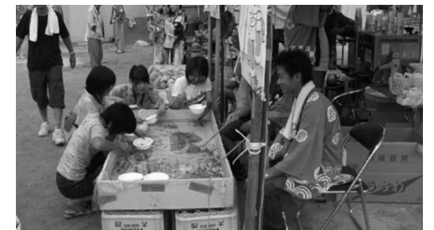
楽しい出店もいっぱい