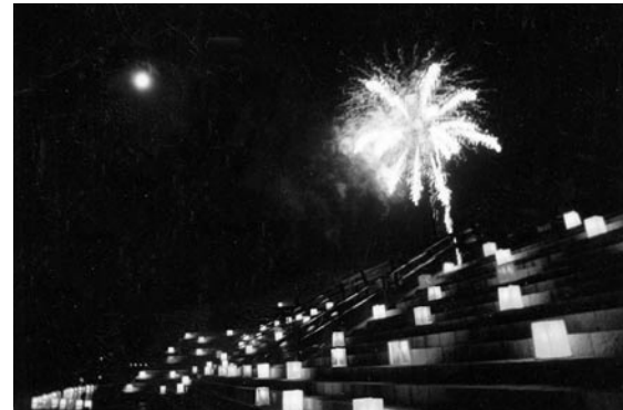
比和川を彩る700個の灯籠と花火