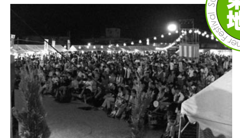
多くの人であふれかえる会場

■問い合わせ 東城遊夏祭実行委員会(東城町商工会内) ☎08477-2-0525