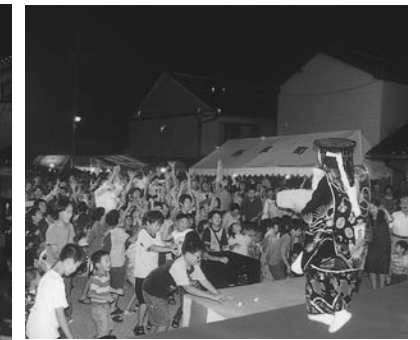
多くの人が集まる福餅まき