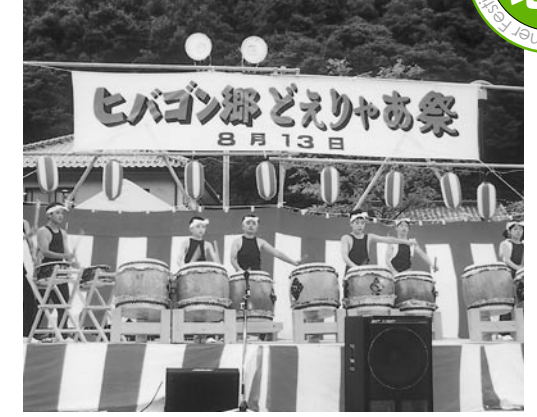
威勢のよい西城川太鼓