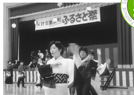
一昨年は雨天により体育館での開催に

■問い合わせ 高野ふるさと祭り実行委員会(高野町観光協会・商工会館内) ☎0824-86-2011