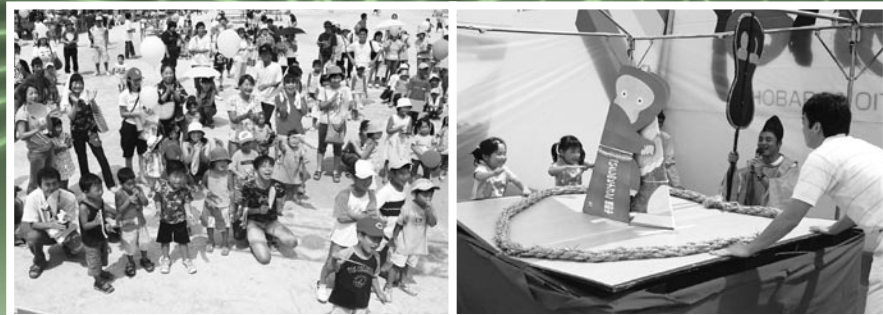
広場には多くの人が集まります 「はっけよーい、のこった!」(昨年の大紙相撲)