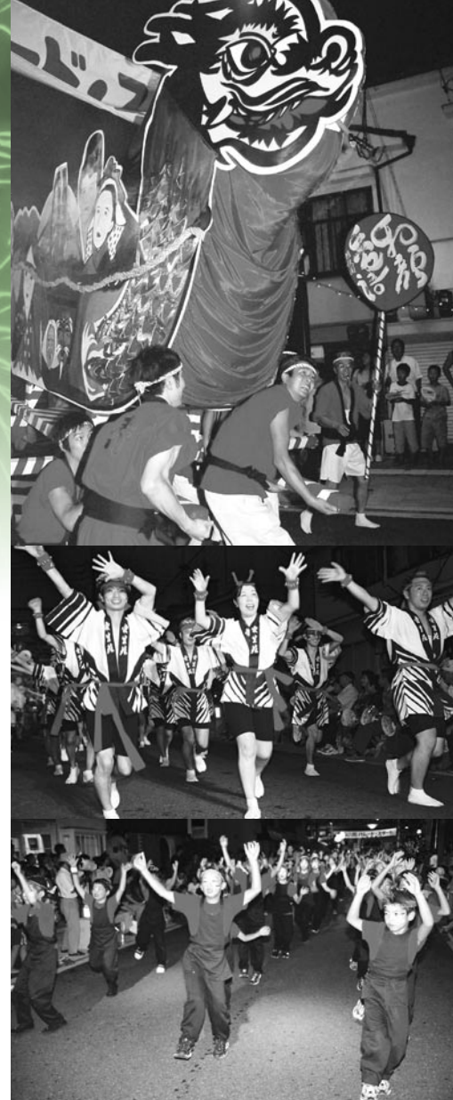
大人も子どもも元気いっぱい!(よいところパレード)

今年も、パレードや花火大会などのメインイベントをはじめ、各種イベントが盛りだくさん。夏の夜を熱く盛り上げる「よいところ祭」にご期待ください!