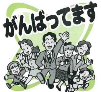
東城町帝釈小学校

東城町の帝釈小学校が、環境保全実践活動を積極的に推進した個人や団体に贈られる「ひろしま環境賞」を受賞しました。