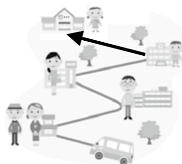
B 戸口運行型予約乗合タクシーのイメージ図

利用できる曜日及び時間帯をあらかじめ決めておいて、予約のあった方の家を回り、乗り合いで目的地まで運行します。