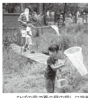
ひばの里で夏の昆虫探しに挑戦

生に教えてもらえるよ！ 「自由研究にも」夏のクラフト教室 大人気の「木工・竹工作教室」をはじめ、蚊帳(かや)の素材を使った「かやの小物作り」、自分の好きな葉をかたどって作る「夏のはっぱで土笛づくり」、かわいらしいペンダントができる「ウッドバーニング教室」など、定番メニューも新メニューも、お土産だけでなく夏の自由研究にもぴったりです。 「地元の特選素材いっぱい！食体験教室」 備北丘陵公園の食体験教室は、すべて「地元自慢の食材」をつかった、こだわりのメニューが揃っています。庄原のそば粉を使用した「手打ちそば体験」に、こんにやく芋100%使用の「こんにやく体験」、大豆の風味がいっぱいに広がる「豆腐作り」など、体験してつくる「格別の味」、ぜひご賞味ください。