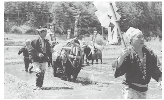
この行事は、宝くじの助成金を受けています。