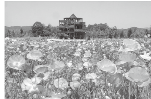
花の広場いっぱいポピー

連休が終わわり一息つきたくなるこの季節、備北丘陵公園では4万本のシャリーレポピーが見ごろです。赤色の花が鮮やかなポピーは、初夏の青空をバックに美しく咲き誇ります。『花の広場』では絨毯のように広がるピオラの花も楽しめる他、『ひばの里』ではアヤマやスイレンなどの季節の花も咲いています。一