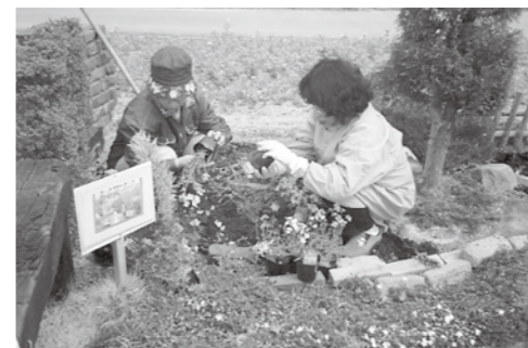
楽しく活動しています(寄せ植えの風景)

年でも最も過ごしやすいこの季節、のんびりゆったり初夏の散策やサイクリングにも最適です。 ■期間 5月13日(土)～6月7日(月) 「遊びの学校」にはアウトドアッキングや染物体験など、毎月第3土曜日に