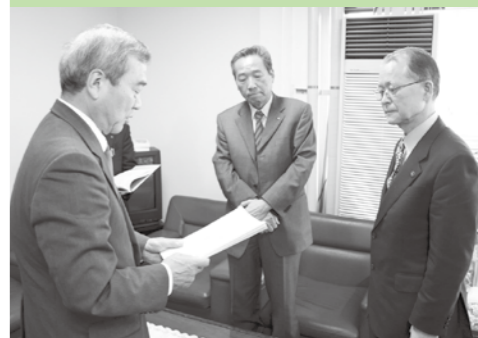
県立広島大学野原委員長(左)が市長に対し、提言書提出(4月19日)