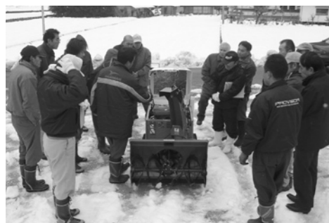
除雪機の操作説明を聞く自治振興区の皆さん(平子自治振興区)

庄原市内の自治振興区などが、(財)自治総合センターの平成17年度コミュニティ助成事業の助成を受けて、除雪機やテント、発電機、太鼓などを購入しました(詳細は下表のとおり)。コミュニティ助成事業とは、同センターがコミュニティの健全な発展と宝くじの普及広報のため、宝くじの財源を基に、一定基準のコミュニティ活動 に対して助成を行うものです。西城地域の自治振興区と総領支所では、除雪機を購入し、この度の大雪による被害防止のため、高齢者世帯や生活道の除雪を行うなど、地域課題の解決に向けて地域活動の充実に努めています。