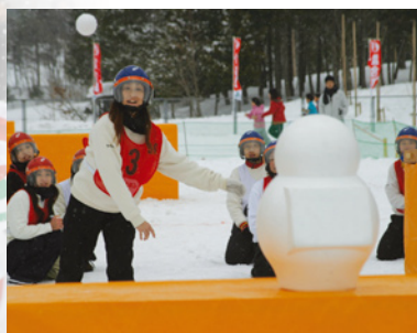
セットポイント同数によるピクトリースロー