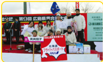
レディースの部優勝の「美異茄子」