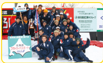
一般の部優勝の「よっちゃん1号」

なお来年は、「第6回全国小学生雪合戦大会」を庄原市高野町で開催することが決定しており、「雪合戦のまち」として全国へ広く発信していくこととなります。