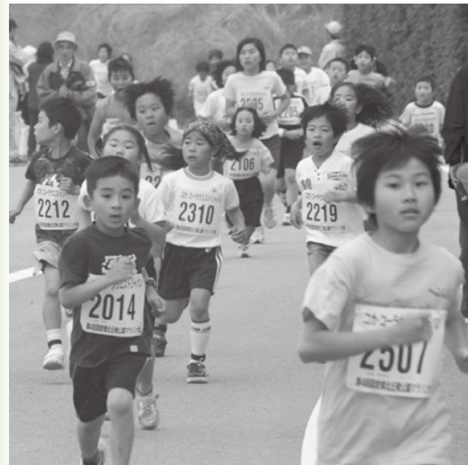
みんな楽しく走ろう!

新緑の公園を代表するイベント「国営備北丘陵公園マラソン大会」が、今年も5月に開催されます。この時期の公園は、芝生広場やつどいの里をはじめ、眩しい日差しと鮮やかな緑がいっぱい、毎年多くの参加者が訪れ、ランニングを楽しんでいます。さわやかな風の中を、自分のペースで楽しく走って