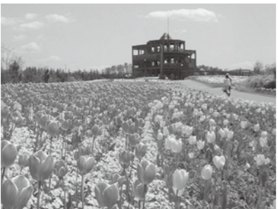
花の広場には、チューリップをはじめ春の花がいっぱい

■無料入園日 4月23日(日)・29日(土)、5月5日(金) ※5月5日は子どものみ無料