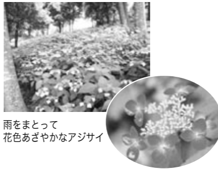
雨をまとい 花色あざやかなアジサイ

備北公園管理センター ☎0824-72-7000 (http://www.bihoku-park.go.jp/)