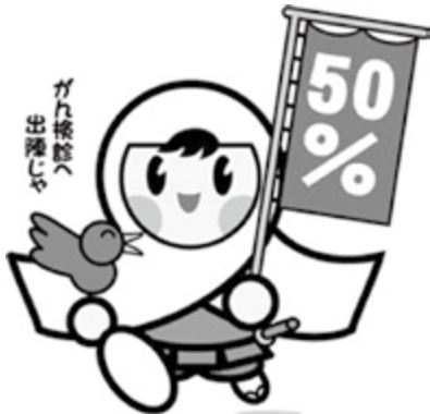
がん検診推進50%キャラクター