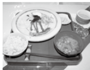
材料にこだわった日替わりランチ

日替わりランチなどが楽しめる軽食喫茶は、地元庄原産の野菜にこだわったメニューを提供しています。休憩所やトイレ利用としても気軽に立ち寄りください。 営業時間は9時から16時(ランチは11時から14時)まで。 毎週土・日曜日が店休日(予約営業有り)