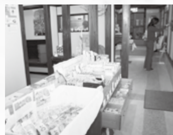
特産品販売コーナー