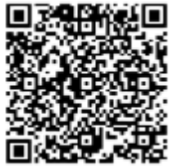
防災情報提供センター 携帯端末用QRコード

れまでは、庄原市を含む「広島県」「北部」、あるいは「備北」に対して警報・注意報を発表していましたが、5月27日(予定)からは、「庄原市」を明示して発表します。ただし、テレビやラジオ、177天気予報サービスなどでは、市町単位で発表されている気象警報・注意報を簡潔に、かつ短時間に伝える必要があるため、これまで通りの名称でお知らせする場合があります。 なお、市町ごとの気象警報・注意報の詳細な内容は、広島地方気象台ホームページや国土交通省防災情報提供センターの携帯電話サイトに掲載する予定です。 問い合わせ 広島地方気象台防災業務課 0822233953 http://www.jma-net.go.jp/hiroshima