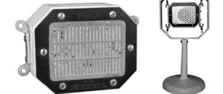
サイズ:高さ9cm×横14cm×奥行8.5cm 重さ:1.6kg 使用状況(模型)

これは、昭和の初め頃に使用されていた「ライツ型カーボンマイクロフォン」です。1924年(大正13年)、ドイツのライツ博士によって発明されたマイクです。