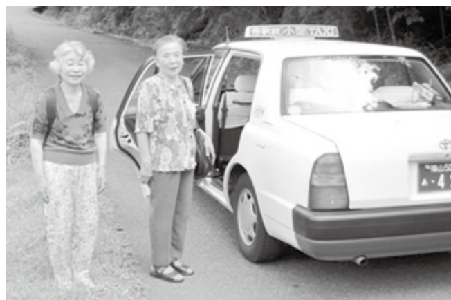
帝釈自治振興区で始まった市民タクシーの試験運行

市民タクシーの試験運行を実施 市は、生活交通を確保するため、新たに「市民タクシー運行事業」の制度化に向け、7月～9月の3カ月間、試験運行を実施しています。 この市民タクシー運行事業は、自治振興区が事業主体となり、タクシー事業者と運行契約を結び、移動手段を確保する取り組みに対して支援するもの。市は運行に係る費用の3/5を補助することとしています。 試験運行の結果を踏まえ、現在検証している制度の内容を十分に検証した後、新たな補助事業を制度化する予定です。