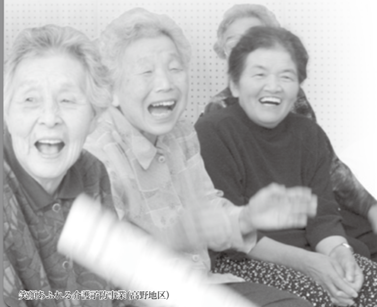
笑顔あふれる介護予防事業(高野地区)

笑いで健康になる 笑うと副交感神経の働きが活発化。心臓や呼吸、血圧などの動きが緩やかになり心身共にリラックスします。緊張の多い人ほど笑いが必要です。