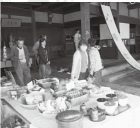
ギャラリーでにぎわう三楽荘

また、まちなかの他の魅力もPRして、三楽荘を中心にまちなか全体が活性化することを期待しています。