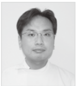
西城市民病院 歯科部長