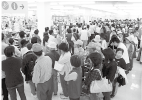
商品券を求め行列