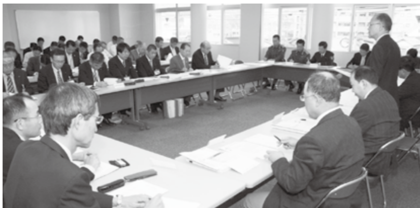
関係機関が集まった対策本部会議

会議では、新型インフルエンザの感染が疑われる方を最初に診察する発熱外来を庄原赤十字病院と庄原市保健センターに設けることなどの対応を協議。その後、市は相談窓口の設置や、市民への広報などを行いました。また、国内でも感染者が拡大してきた5月19日には、庁内連絡会議を開催し、学校の対応やイベントの開催などについて協議を行いました。