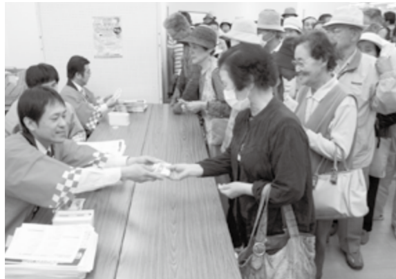
ジョイフルに設けられた販売所

また、取り扱い加盟店では、商品券を使用した際に特典を付けるなど、商品券に関するサービスを提供して行いました。庄原商工会議所と東城町商工会が発行した商品券は2日目に完売しました。備北商工会の商品券は、ウイグル西城や備北商工会の各支所で販売しています。