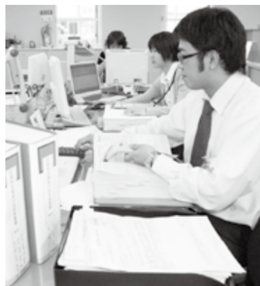
申請書の受け付け作業をする職員

から口座振込で支給されています。申請書の提出期限は定額給付金が9月28日、子育て応援特別手当が10月15日です。まだ提出されていない方は、お早めに提出してください。