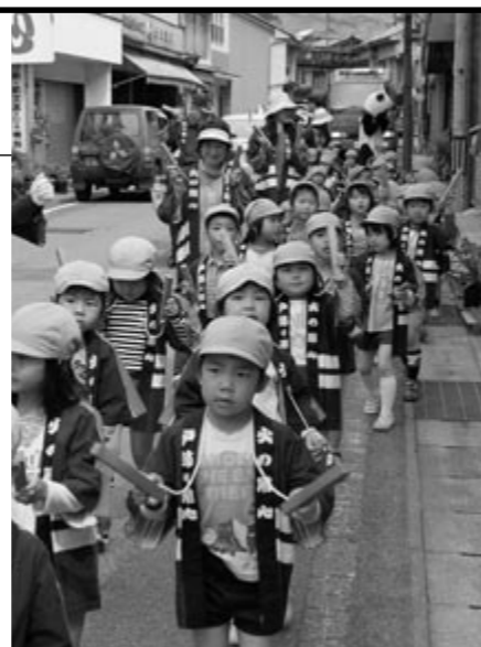
火の用心を呼びかけて歩く子どもたち ▶

火の用心と書かれたおそろいの法被を着た園児たちは拍子木を打ち鳴らし、「火の用心 みんなで守ろう 火の用心」と声をそろえて呼びかけました。沿道の住民は、かわいい子どもたちの列に声援を送り、防火に対する意識を新たにしました。