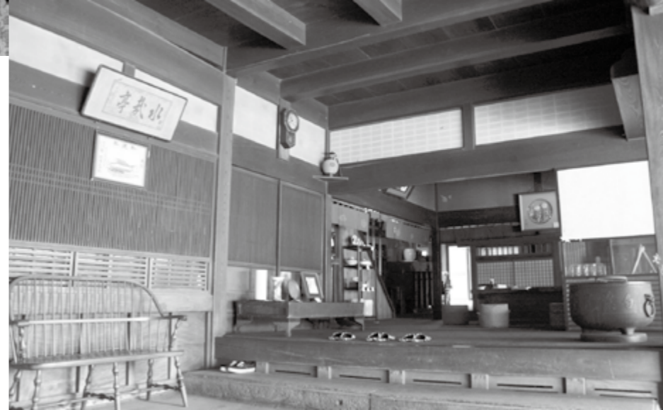
高価な材料を多用した母屋