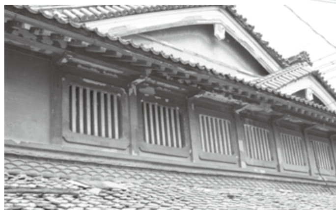
傷みが激しい屋根