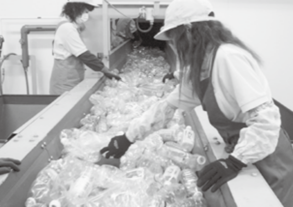
手選別されるペットボトル

新たに液晶・プラズマテレビと衣類乾燥機が追加されました。対象品目を処分する場合は、排出者が家電リサイクル料金を支払わなければなりません。