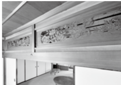
屋久杉の1枚板を透かし彫りした欄間