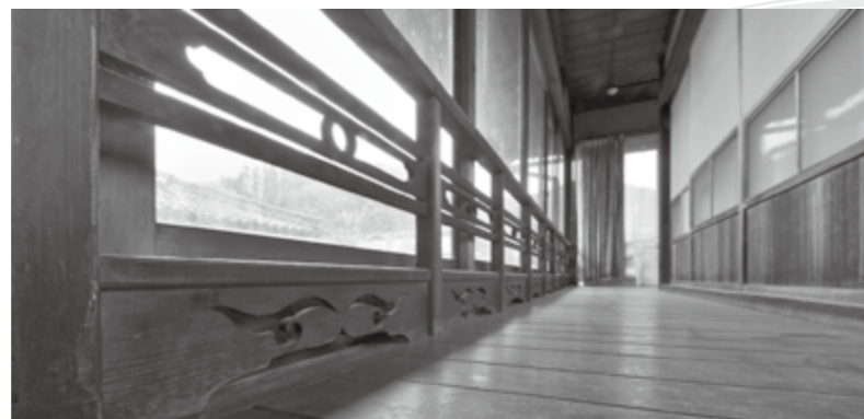
離れ2階の手すり付きの縁側