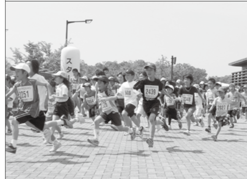
▲元気良くスタートする子どもたち

新緑の中をさわやかに駆け抜ける第8回国営備北丘陵公園マラソンが5月13日、公園内で行われました。