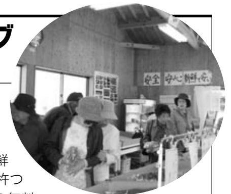
▲買い物客でにぎわう特産市場