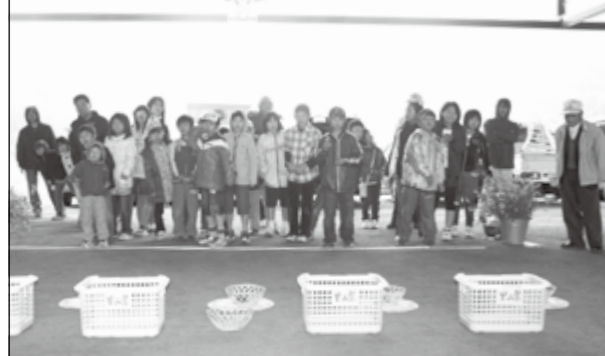
▲なの花を飛ばしてかごに入れる

「第1回総領なの花まつり」が4月26日に開催されました。約15万本のなの花を楽しんでもらおうと、市役所総領支所や観光協会などが企画。当日は雨天のため、なかつくに公園から田総の里スポーツ公園の雨天ゲートボール場に会場を移して行われました。