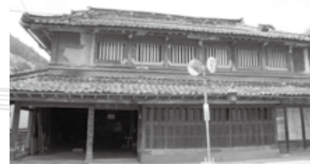
正面から見た三楽荘

「現在、雨漏りがしている状況なので、まず傷みが激しい屋根瓦などの修繕を急がなければいけないと思っています。その他の修繕については、活用方法がまとまってから決めていきます。改修費は、市の試算で約7500万円を見積もっていますが、活用方法によっては増減することが予想されます。また、維持管理費についても、活用方法によって異なりますが、地元住民の方から「掃除や庭の手入れなど、自分たちでできることは協力する」と言っていたので、市民パワーを活用しながら経費節減に努めていきたいと思っています。」