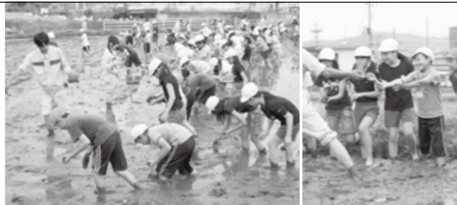
▲泥だらけになりながら苗を植えていく子どもたち

泥んこになって植えた子どもたちは「泥の感触が気持ちよかった」「歩くのが難しかったけど、楽しかった」と笑顔でした。