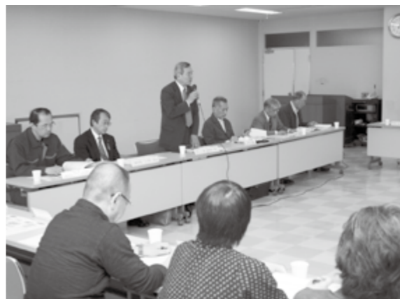
東城市街地活性化事業推進市民会議