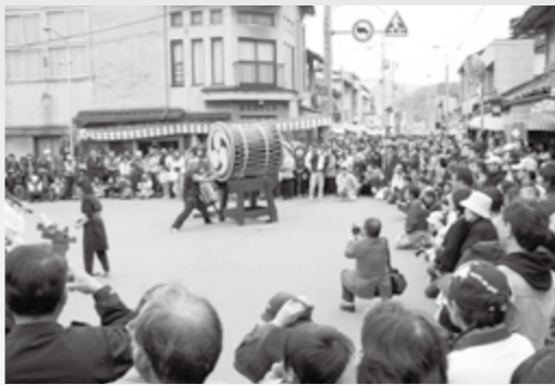
伝統行事「お通り」でにぎわう三楽荘前