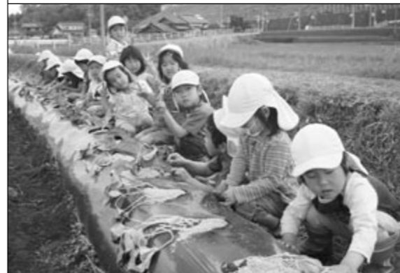
▲苗を植え付ける子どもたち

永末保育所(園児16人)が5月13日、地元の農業法人「夢ファーム永末」の協力で、サツマイモの植え付け体験をしました。