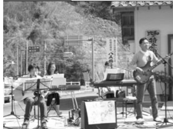
▲市場前でバンド演奏