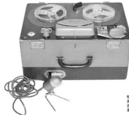
幅:42cm 奥行き:28cm 高さ:24cm 重量:11.5kg