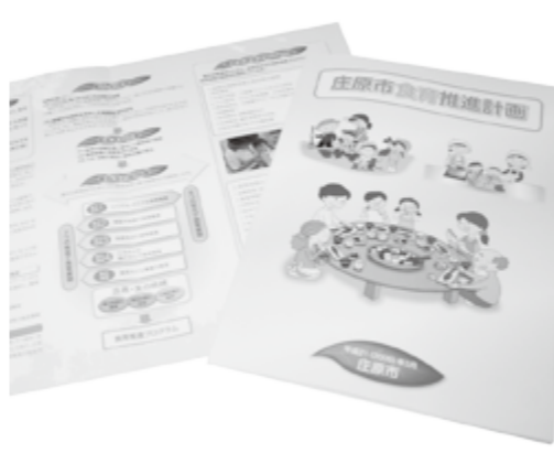
各世帯に配布した計画の概要版