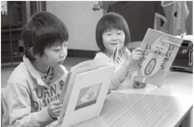
朝の読書活動(峰田小)