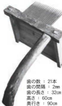
歯の数：21本 歯の間隔：2mm 歯の長さ：32cm 高さ：60cm 奥行き：90cm