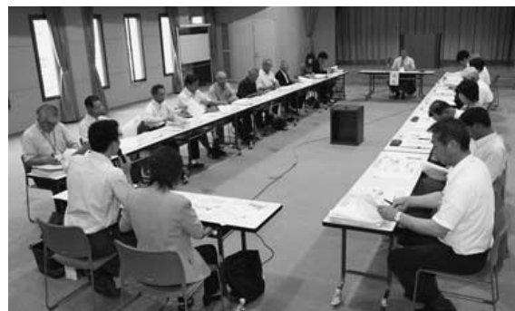
一般公開して行われた会議

らは地域が主体的に生活交通を考えていく必要がある」「地域の実態にあった効率的な運行を検討すべき」など、活発な議論が交わされました。