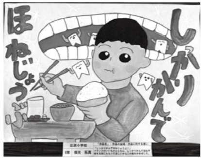
【議長賞】 板矢 拓真(庄原小6年)