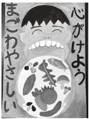
【教育長賞】 奥村 桃季(永末小3年)