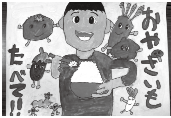
【市長賞】 板矢 直幸(庄原小3年)