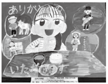
【農業委員長賞】 藤谷 アイリ(山内小5年)