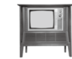
大きさ:93cm(高さ)、95cm(幅)、55cm(奥行)、43kg(重さ)