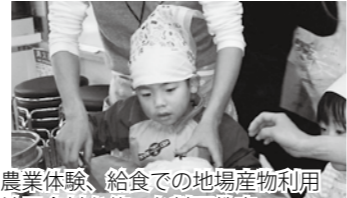
農業体験、給食での地産物利用 地元食材を使った料理教室 伝統料理講習会 など