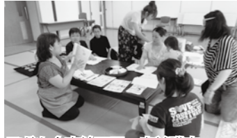
子ども食育絵画展、出前講座 離乳食教室、料理教室 など