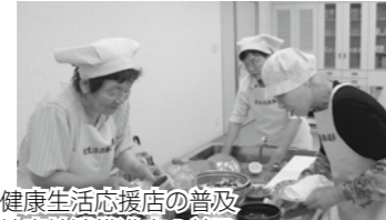
健康生活応援店の普及 地産地消推進店の普及 食育推進員養成講座の開催 など