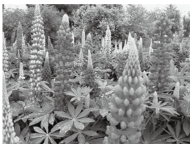
ルピナス(見ごろ：～6月中旬)

初夏の季節を迎えました。5月17日(火)から7月3日(日)までの期間を「初夏の花物語」として、この期間に咲く花を紹介していきます。シャレーポピー、ルピナス、ラークスパー、アジサイなどの「開花リレー」が続きます。今回はこの中から「ルピナス」をご紹介します。