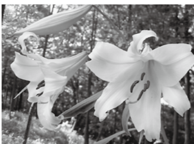
ササユリ(見ごろ：6月中旬～6月下旬)

公園では「ササユリ」の保全育成に取り組んでいます。もともと園内にあった自生株と、特殊な栽培により